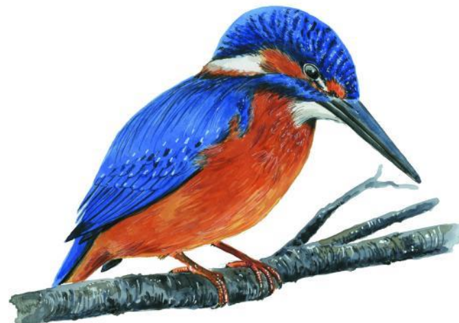
Zimorodek Alcedo atthis